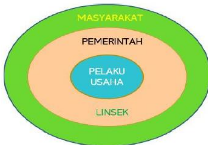
Gambar 2. 1 Tiga Pilar Pengawasan Obat dan Makanan

Dalam menjalankan tugas dan fungsinya, BPOM tidak dapat berjalan sendiri, sehingga diperlukan kerjasama atau kemitraan dengan pemangku kepentingan lainnya. Dalam era otonomi daerah, khususnya terkait dengan bidang kesehatan, peran daerah dalam menyusun perencanaan pembangunan serta kebijakan mempunyai pengaruh yang sangat besar terhadap pencapaian tujuan nasional di bidang kesehatan. Pengawasan Obat dan Makanan bersifat unik karena tersentralisasi, yaitu dengan kebijakan yang ditetapkan oleh Pusat dan diselenggarakan oleh Balai di seluruh Indonesia. Hal ini tentunya menjadi tantangan tersendiri dalam pelaksanaan tugas pengawasan, karena kebijakan yang diambil harus bersinergi dengan kebijakan dari Pemerintah Daerah, sehingga pengawasan dapat berjalan dengan efektif dan efisien. Pada Gambar dapat dilihat hubungan antara pemerintah, pelaku usaha, dan masyarakat dalam pengawasan Obat dan Makanan.