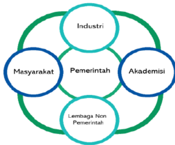
Gambar 2. 2 Penta helix Pengawasan Obat dan Makanan

Namun demikian, pengawasan Obat dan Makanan sejatinya masih memerlukan adanya sinergitas dengan pemangku kepentingan lain di antaranya akademisi dan media, mengingat perannya sangat penting di dalam mendukung kelancaran program pengawasan Obat dan Makanan. Sehingga perlu sinergisme dari lima unsur yaitu pelaku usaha, masyarakat termasuk lembaga non pemerintah, pemerintah, akademisi, media dalam sebuah model yang dinamakan Penta Helix . Model sinergisme ini diharapkan akan menjadi kunci pengawasan Obat dan Makanan yang lebih efektif.